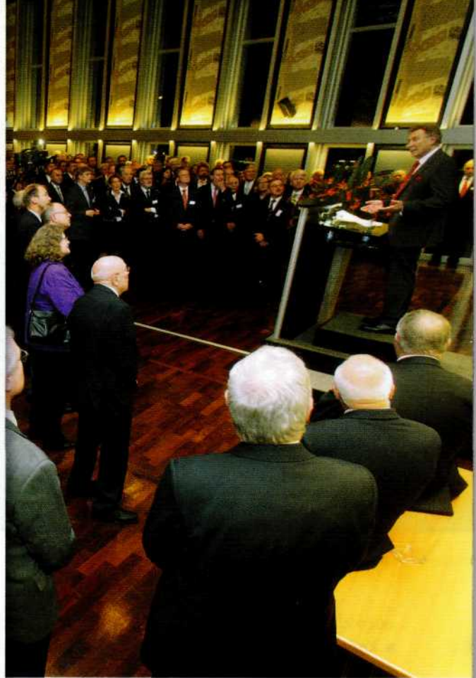
Der Jahresempfang war mit mehr als 700 Gästen auch diesmal wieder sehr gut besucht.